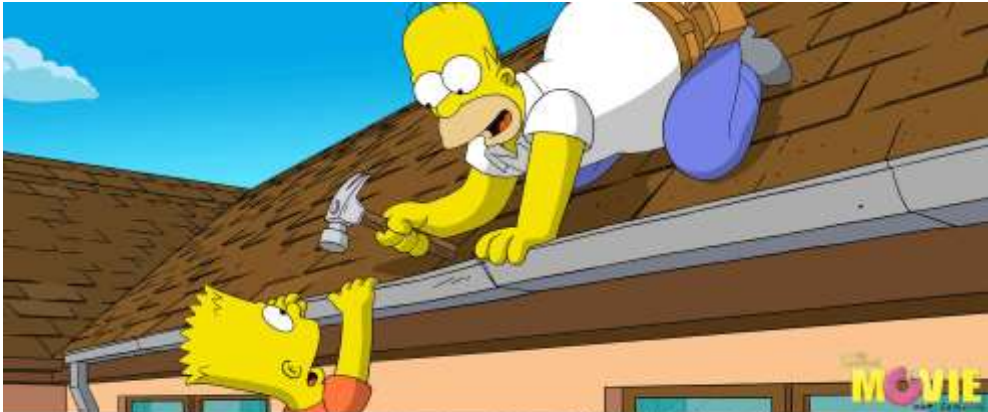
5-1 A simple household task turns into mayhem for Homer Simpson and Bart Simpson in THE SIMPSONS MOVIE. Still credit: Matt Groening. The Simpsons TM and © 2007 Twentieth Century Fox Film Corporation. All rights reserved. Not for sale or distribution.