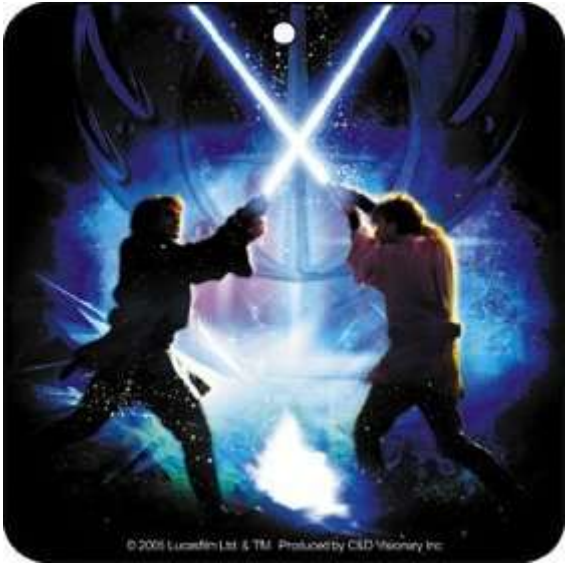
© 2005 Lucasfilm Ltd. & TM. Produced by C&D Visionary Inc.